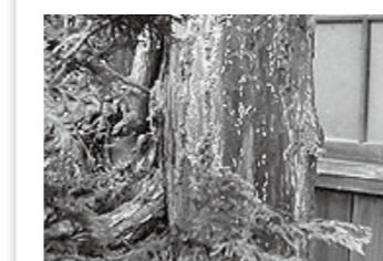
【写真1】ヒノキ科の立ち木に侵入したシロアリ

シロアリと樹木は化学物質を介してせめぎ合っている。樹木の化学物質が弱まるか、シロアリの勢力が上回ればシロアリは樹木に侵入加害する。ヒノキだ!ヒバだ!は一切関係ないのが弊社が見てきた事実です。