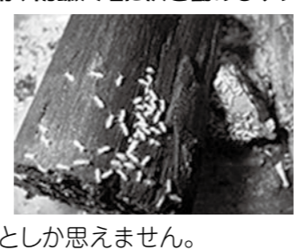
【写真2】防腐剤の上で活動する証拠

炭に群がるヤマトシロアリの決定的現場。「炭はシロアリを寄せ付けない」などとなどというのはインチキセールスの代表です。有名な工務店でも勧めてるっていうから大規模詐欺としか思えません。