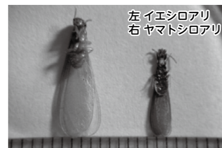
左 イエシロアリ 右 ヤマトシロアリ

そしてそのシロアリの存在が年に一度だけ、あなた様でも確認できる現象が、群飛(スウォーム)です。群飛の場合、一度に出現する羽アリ(有翅虫)は50,000頭(シロアリは一頭二頭と数えます。)程度ですから、