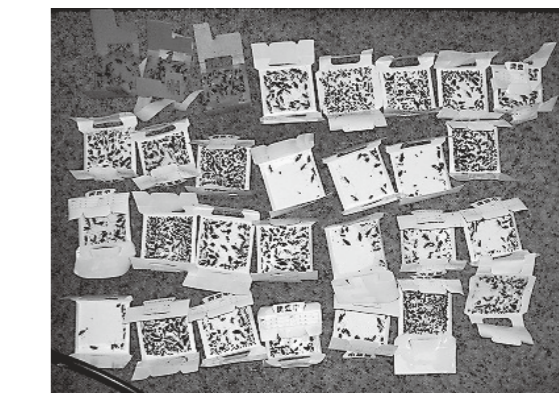
SOSが発せられたレストラン どうして今まで専門業者に管理させていなかったのか?

飲食店で繁殖する ゴキブリ で、大変な問題を起すのは、 チャバネゴキブリ と呼ばれている種類です。学名は“ Blattella germanica ”と表されますが、何だかイタリア料理か、高級ワインのよう