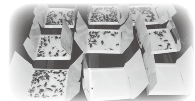
調査用資材に捕獲されたチャバネゴキブリ (今まで私共が管理をしていなかったお店です。)