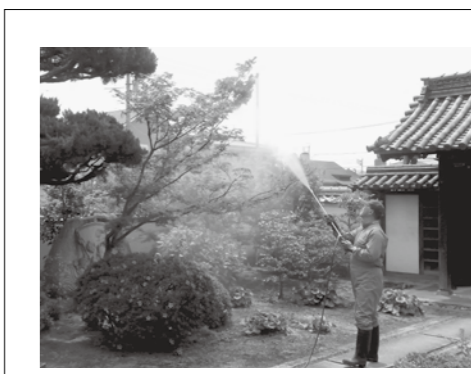
■寺院での毛虫駆除風景