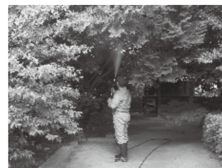
■神社境内での施工

岡山県南では、春を迎えて気温が高くなってくると、毛虫の被害の問い合わせが急増して参ります。