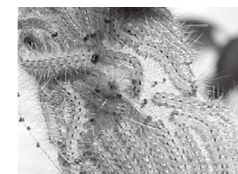
アメリカシロヒトリ (無害)

アメリカシロヒトリは、毛による炎症などは無いのですが、食欲旺盛で、大きな葉を、またたく間に葉脈だけ残すほど食い荒らすので、サクラなどは無残な景色になってしまいます。(葉桜になったら注意)