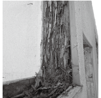
3. 窓のサッシを外して内部を見ると、 壁に中の柱まで食い荒らされている

を調べるところからお付き合いが始まり、弁護士を通 じての再調査、正式な報告書作成、裁判、和解後、住 宅リフォーム時の防蟻工事まで関わりました。(お客 様は元住人に賠償請求した。)