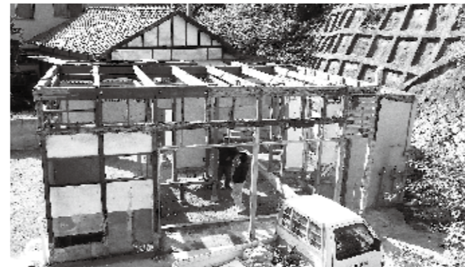
1. 近所の高台から見下ろした、骨組みだけになったシロアリ被害の住宅の全景

上の写真1の住宅は、岡山県南に建つ築年数が25 年ぐらいの、在来工法の木造住宅です。柱や桁、壁 の様子で、素人の方には「平屋一階建」に見えると 思いますが、 実はこの住宅は元々二階建 のとても眺 めがよい家だったのです。(平成23年11月時点)