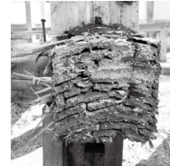
2. 床を支える構造材の内部までシロアリに 食害され、上の重みで潰れてしまった柱

(有)白神環境衛生消毒は、 公益社団法人 認知症の人と家族の会 の活動を支援いたしております。