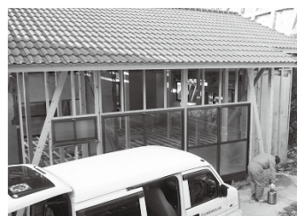
4. 写真1の状態からリフォームを行い、 住宅らしくなった現在の現場で防虫作業。

現在は着々と工事も進 み(平成25年1月現在)、 桜の花が咲く頃には、海 を眺められる別荘となっ て、所有者の元に戻って まいります。(写真4)