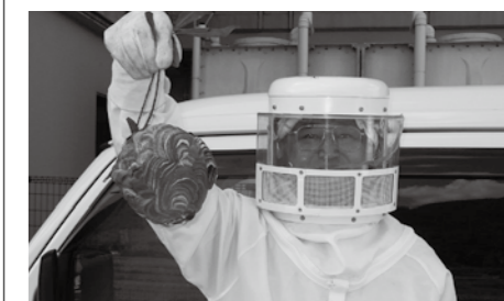
I got it!

翌春、この女王が一匹で巣作りを始め、最初の働きバチが羽化するまでの間、女手一匹で子育てをします。その後、働きバチが増えたら、産卵に専念し、7月頃から巣は急激に大きくなります。